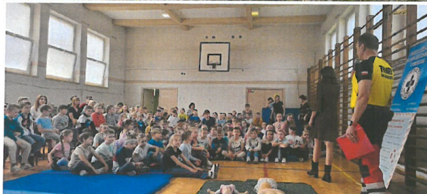
Fot. WOPR w Chełmnie.

Akcje edukacyjne podczas festynów gminnych z udziałem Instruktorów WOPR oraz instruktorów ratownictwa wodnego, promujących pierwszą pomoc oraz bezpieczeństwo na obszarach wodnych. Fot. WOPR w Chełmnie.