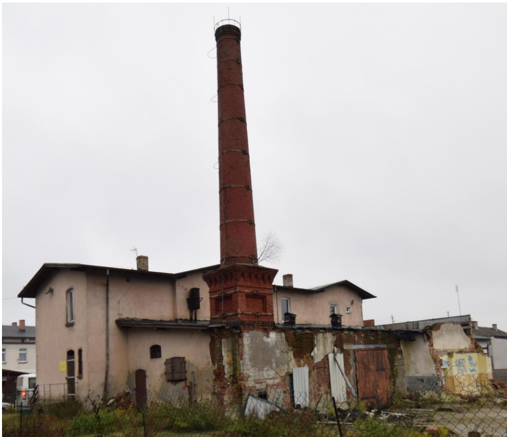
Widok od południowego zachodu