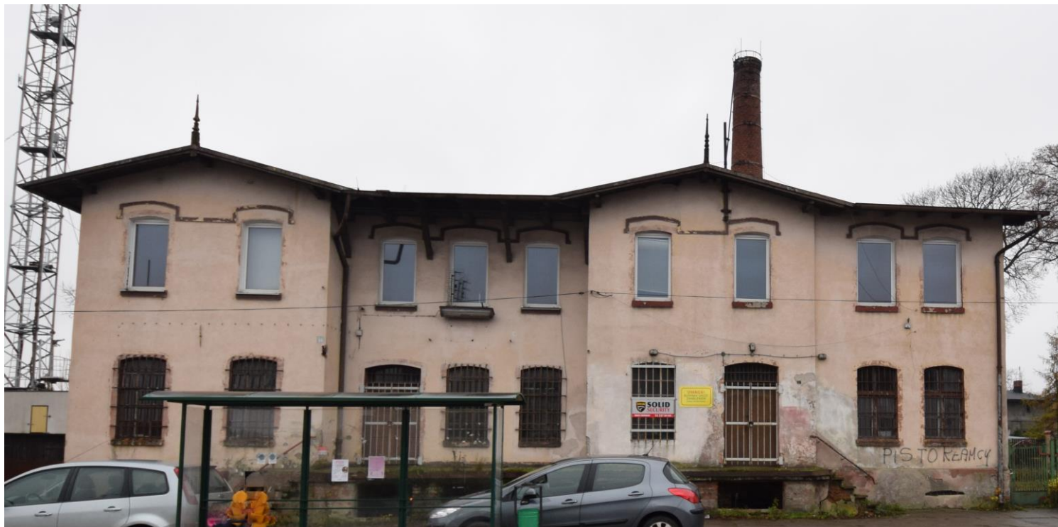
Widok od północnego wschodu

8. Fotografia z opisem wskazującym orientację albo mapa z zaznaczonym stanowiskiem archeologicznym