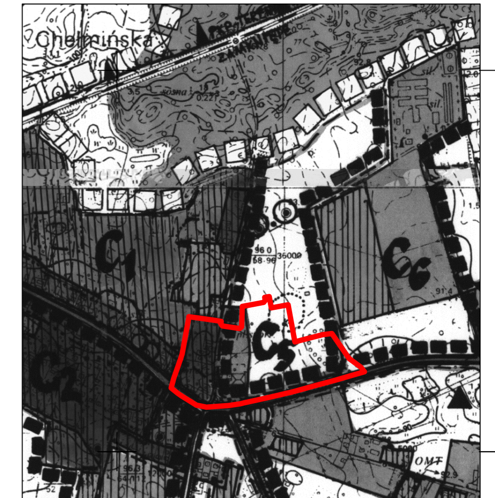
WYRYS ZE STUDIUM UWARUNKOWAŃ I KIERUNKÓW ZAGOSPODAROWANIA PRZESTRZENNEGO GMINY DĄBROWA CHEŁMIŃSKA UCHWAŁA NR XXVII/184/05 RADY GMINY DĄBROWA CHEŁMIŃSKA Z DNIA 7 GRUDNIA 2005 R. skala 1:10 000