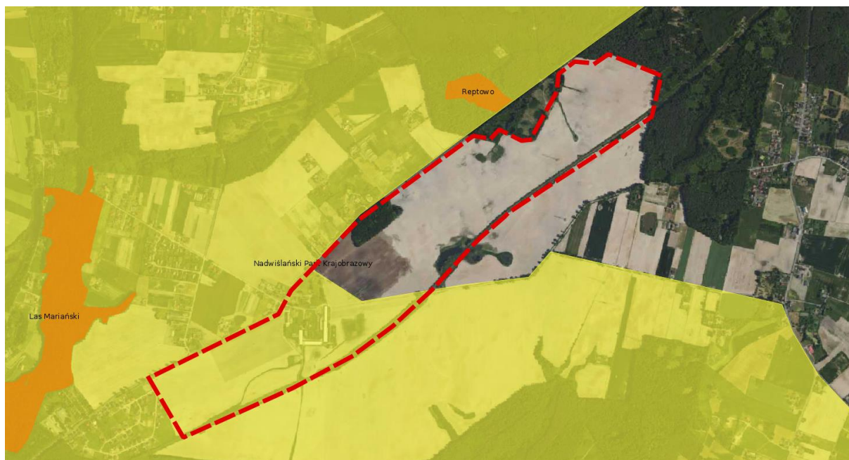
Rysunek 3: Położenie obszaru objętego zmianą studium na tle form ochrony przyrody