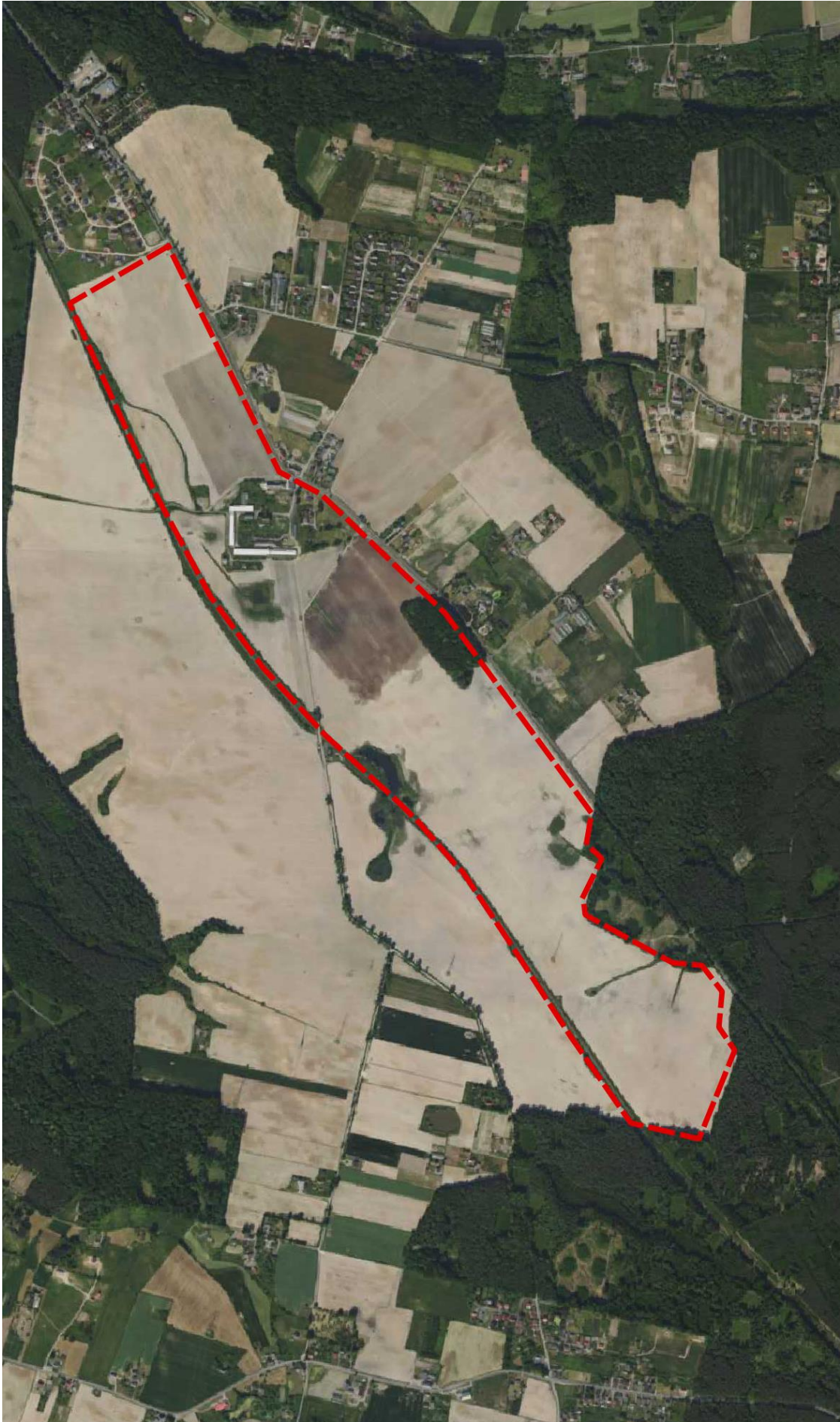
Rysunek 2. Ortofotomapa przedstawiająca obszar zmiany Studium na tle podziału katastralnego